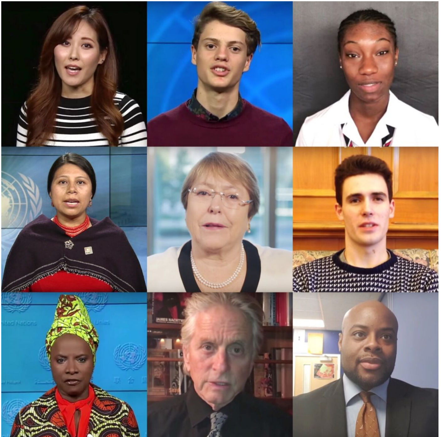
( https://www.un.org/es/udhr-video/ )

Personas de todo el mundo leyendo artículos de la Declaración Universal de los Derechos Humanos en más de 80 idiomas